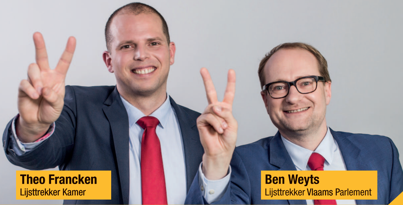
Theo Francken Lijsttrekker Kamer